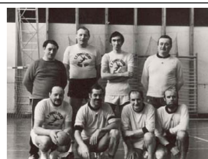
Les dirigeants du Club en 1972

Alors que jusque là le conseil d'administration de la section Plongée-Nautisme lui suffisait, il a maintenant un conseil d'administration propre. Chaque section a sa gestion propre, tant sportive que financière. Elle a également un conseil d'administration propre.