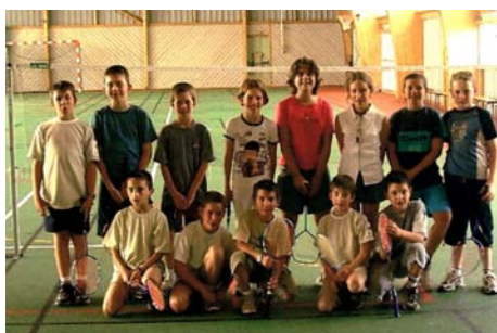
Les jeunes archers et badistes de l'Ecole Multisports en 2000