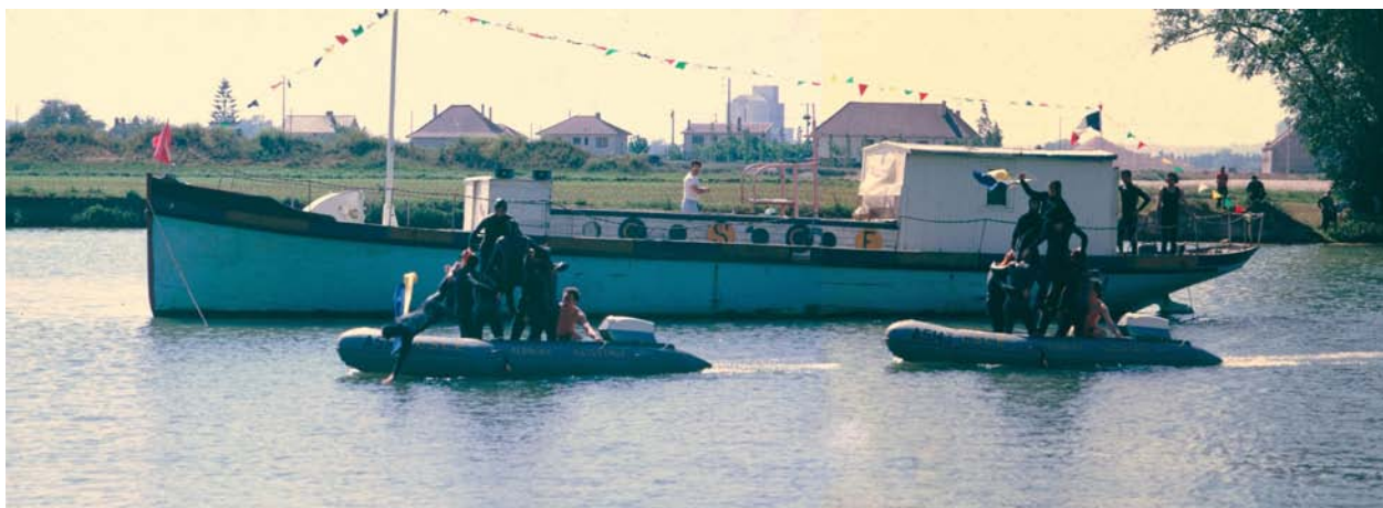
Démonstration du club à de la fête de l'eau de 1973

Actuellement la section Plongée Nautisme est forte de 35 membres, avec la volonté de ne pas dépasser ce nombre pour conserver l'esprit initial.