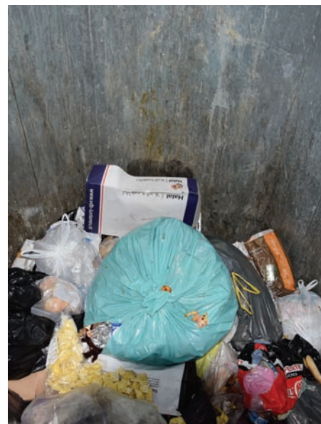
Les bornes d'apport volontaire ne sont jamais pleines lors des collectes, comme ici rue Louis Braille.

Il est vrai qu'au pied des bacs se trouvent des sacs poubelles et encombrants, mais il est important de rappeler que chacun a sa part de responsabilité que ce soit rue des Chesnois ou dans les rues de toutes les communes du territoire du SIRMOTOM. Chaque habitant se doit de respecter les consignes de tri et de mettre les déchets dans le contenant adapté. Il est aussi du devoir des bailleurs d'informer les locataires de ces règles. Du côté du SIRMOTOM, nous assurons notre mission de service public, c'est-à-dire la collecte des déchets dans les containers, et non, au sol puisque la propreté urbaine incombe à la municipalité.